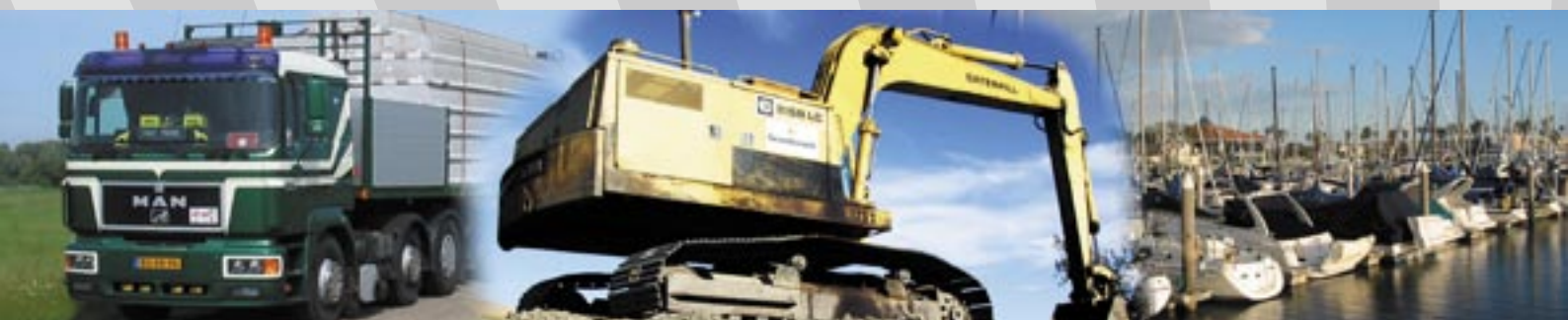
KONTROL MED KØRETØJER